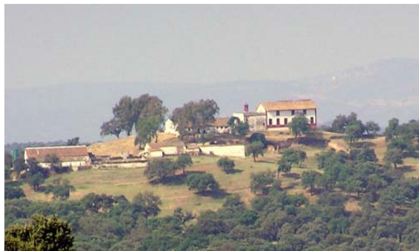
finca La Atalaya

Desde IU esperamos que la gestión municipal del Alcalde se